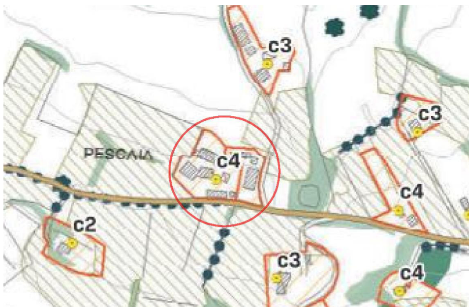
Estratto di Piano strutturale vigente

L'area è soggetta a vincolo paesaggistico secondo l'art. 136 del D. Lgs. 42/2004 - Codice dei Beni culturali e del Paesaggio e ricade all'interno di pertinenze di BSA ma non risulta sottoposta al vincolo idrogeologico od altre tipologie di vincolo.