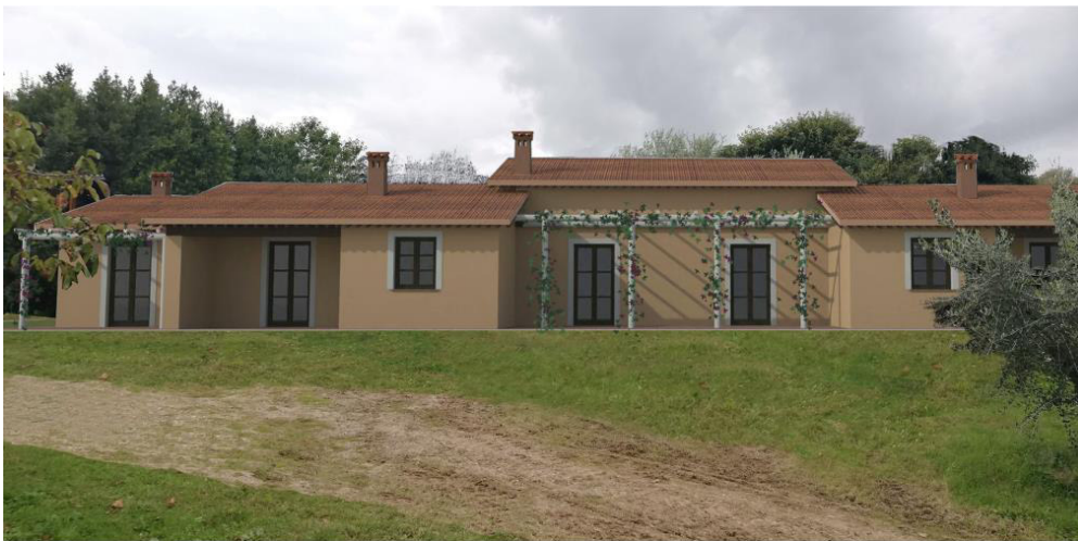
Vista rendering del nuovo immobile in sostituzione dei fienili

Alla luce di quanto sopra esposto, il nuovo manufatto avrà il merito di eliminare un elemento di criticità presente sul territorio con un edificio di notevole minore volume ed impatto visivo ed una rinnovata qualità costruttiva nel rispetto dell'ambiente.