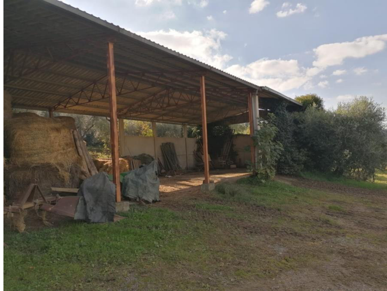
Vista dei fienili esistenti