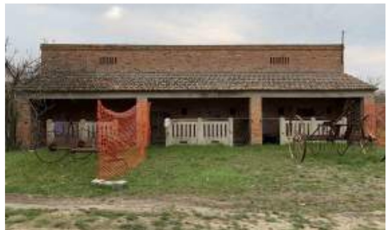
4 - Vista prospetto EST