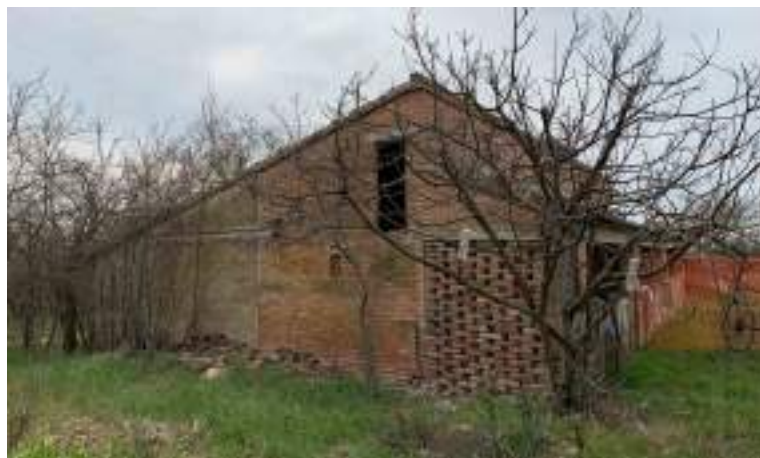
3- Vista prospetto SUD