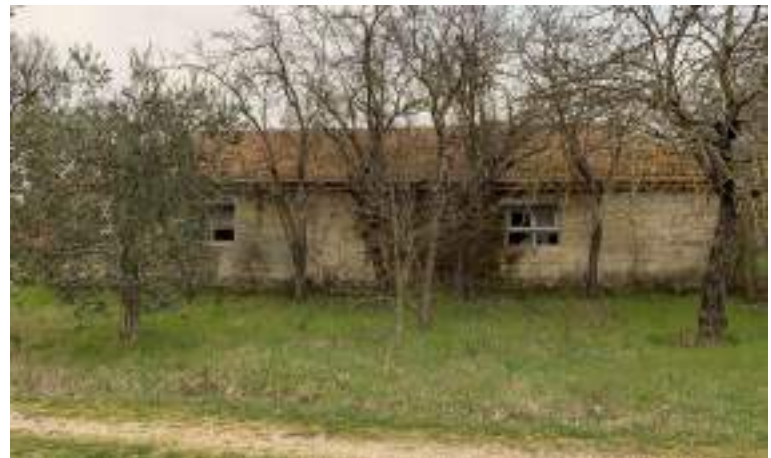
2 - Vista prospetto OVEST