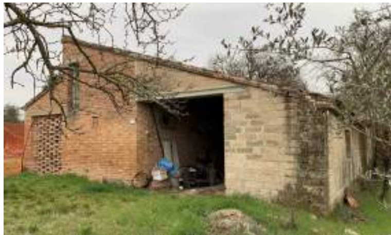
1 - Vista prospetto NORD