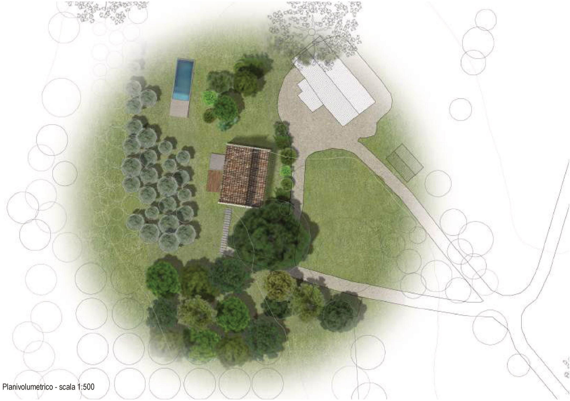
Planivolumetrico - scala 1:500