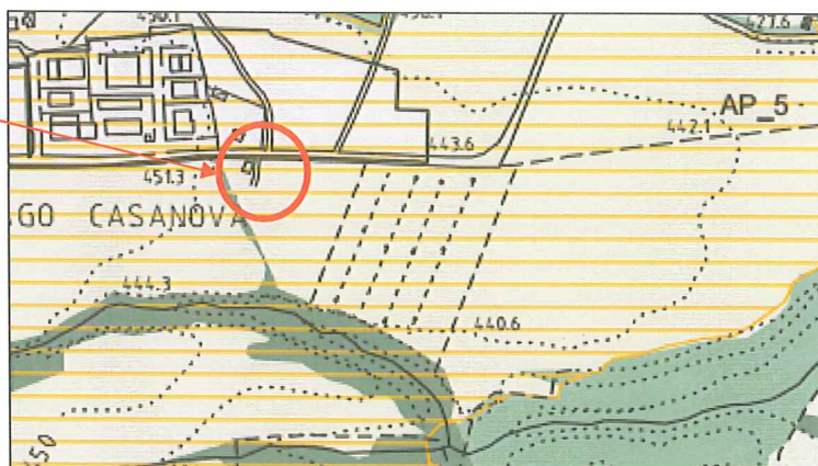
Estratto Tavola R.U. 10K_Tav.03