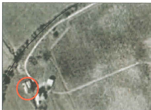
Foto aerea 1978

Per quanto riguarda la U.M.I. "2" Nucleo "B", situata nella frazione del Comune di Montepulciano di S. Albino, si evidenzia che essa è accessibile mediante viabilità pubblica, in particolare S.P. 146, da Via del Cipresso e Strada Vicinale del Pelago.