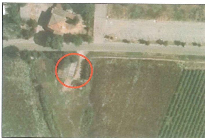
Foto aerea 2013

L'annesso rurale destinato a rimessa mezzi e deposito prodotti che si prevede di realizzare, previa demolizione dell'esistente, sarà collocato nella medesima posizione del manufatto edilizio esistente, a distanza di 10 mt dalla strada pubblica.