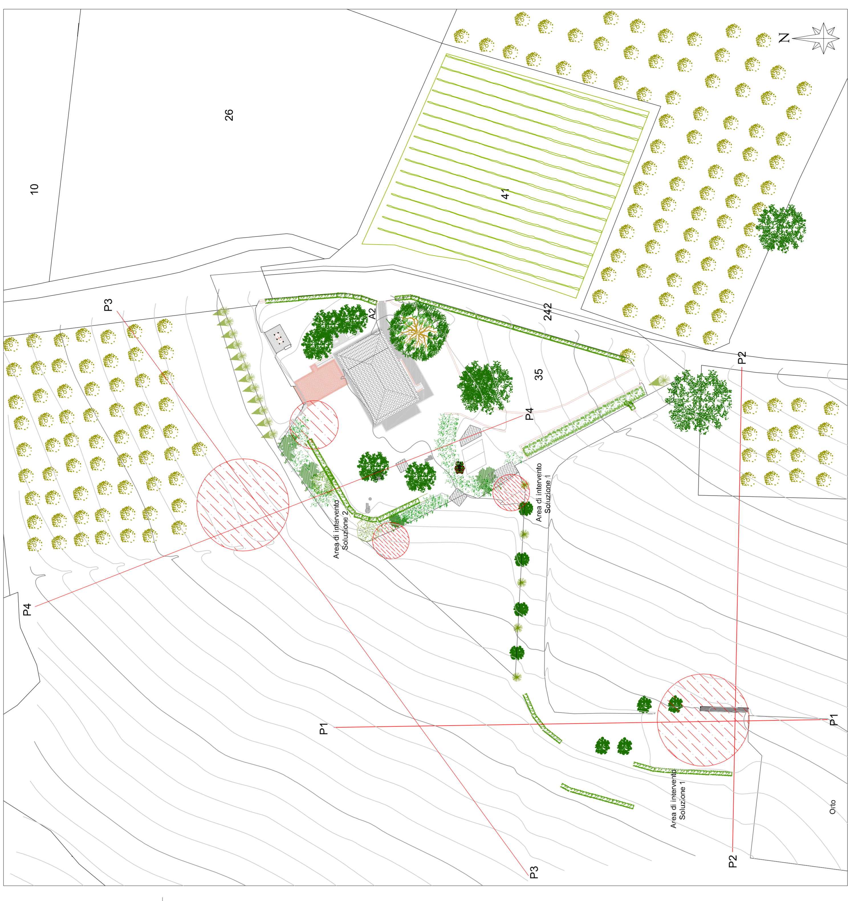
STATO ATTUALE - Planimetria generale Scala 1:500