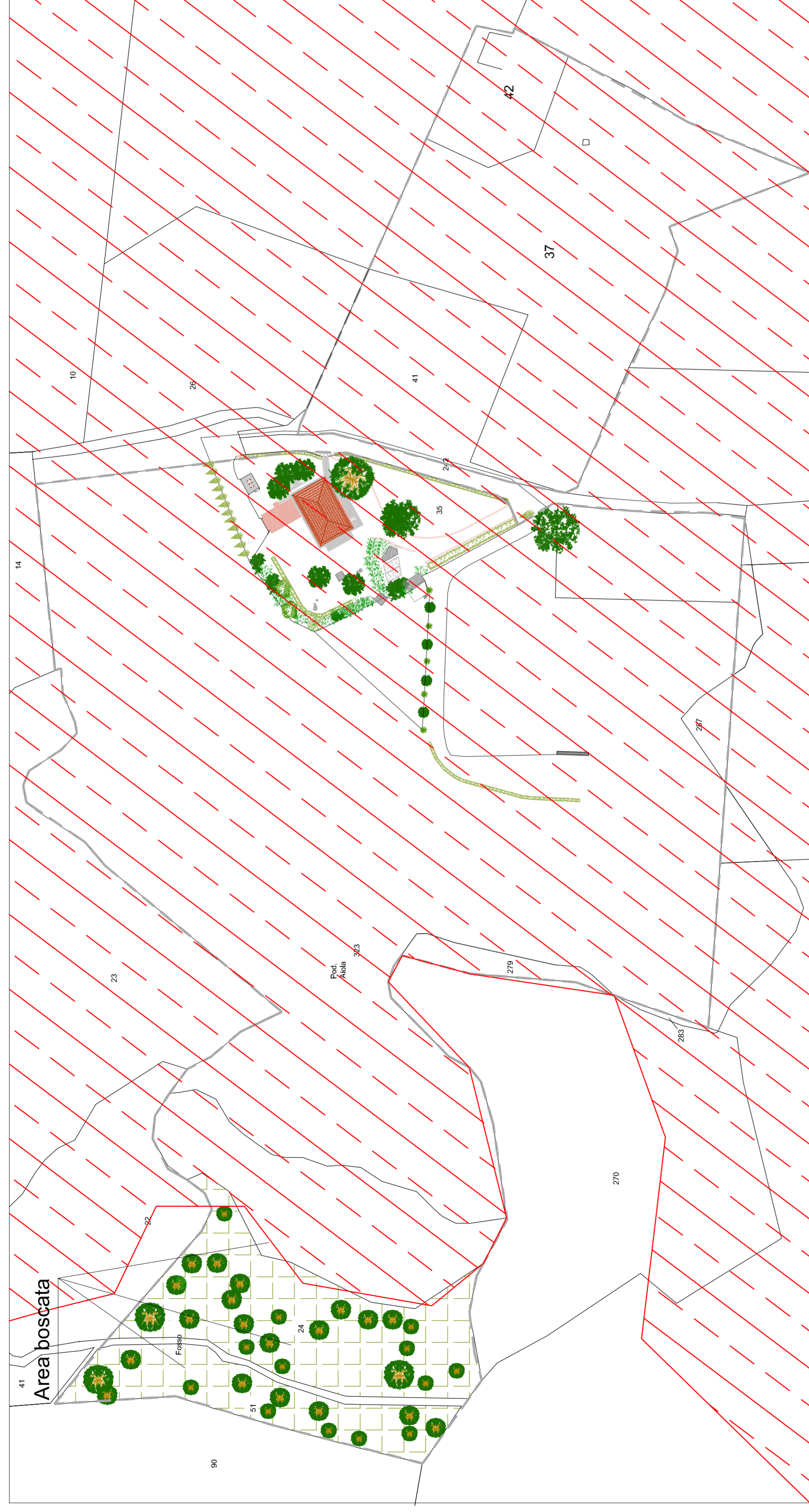
Planimetria generale Scala 1:1000