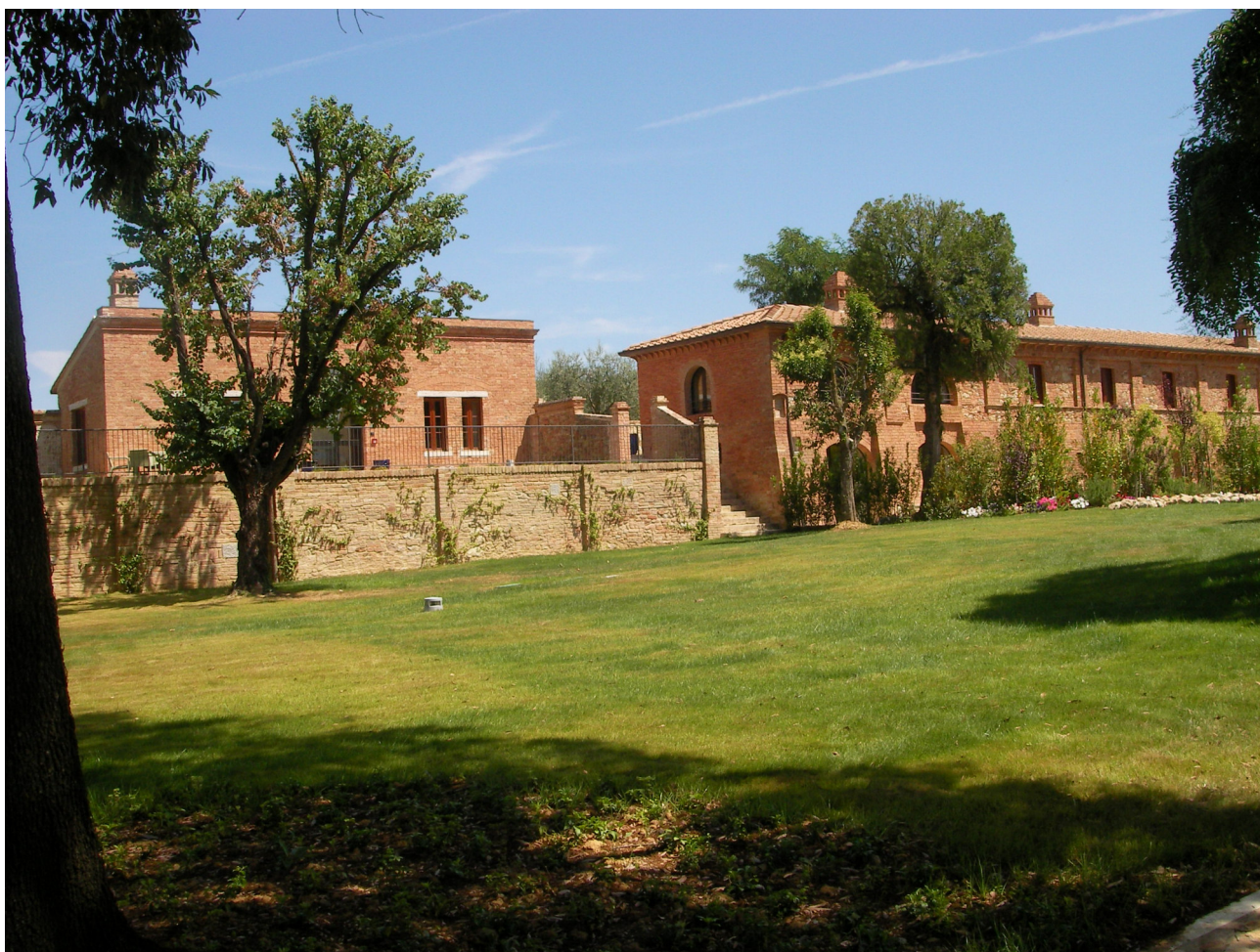
Foto n. 3 – Vista del muro destro il fabbricato è interno al muro completamente interrato 2023