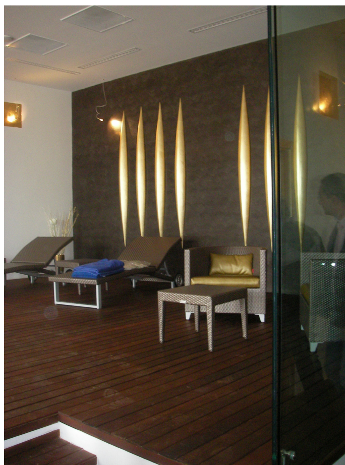
Foto n. 7 - 8 – corridoio e porte stanze massaggi e trattamenti 2023 – area relax