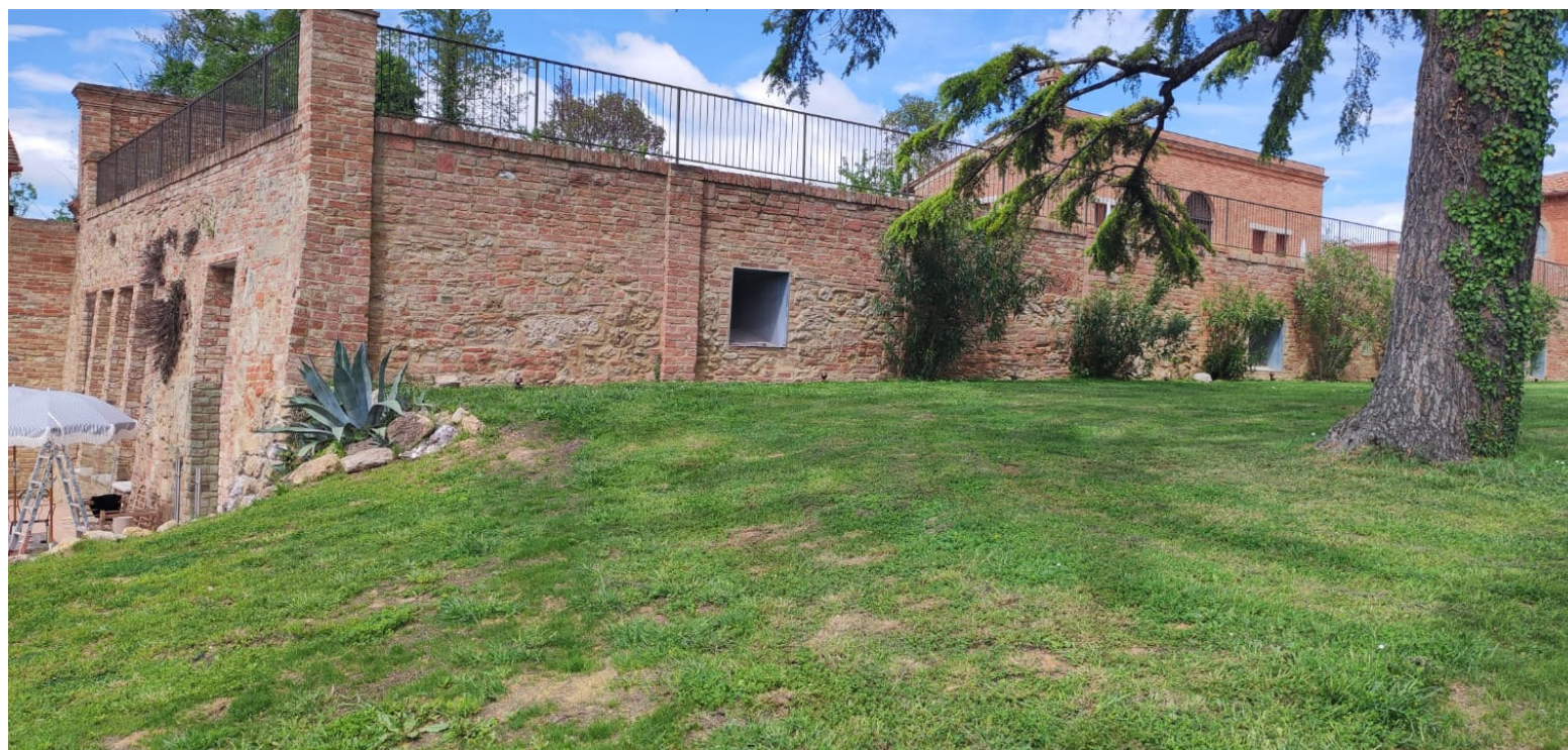
Foto n. 9 – fronte e lato destro si vede sopra il terrazzo giardino 2023