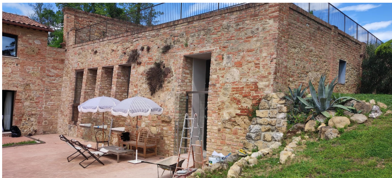
Foto n. 10 – Foto del fronte di entrata alla beauty farm interrata 2023