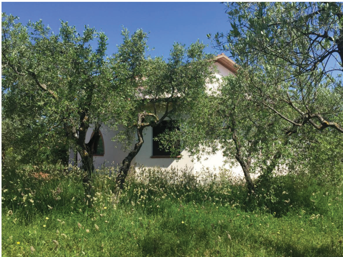
FOTO 4 - Veduta del fabbricato ripreso dal resede esclusivo.-