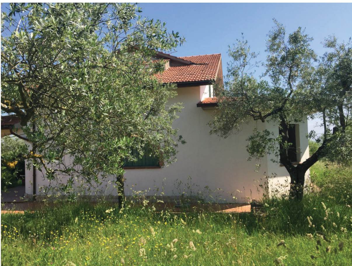
FOTO 2 - Veduta del fabbricato ripreso dal resede esclusivo.-