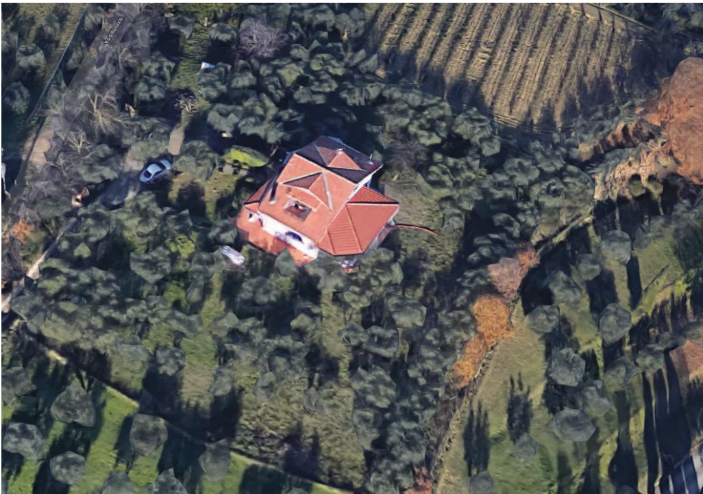
FOTO 8 - Veduta aerea del fabbricato.-