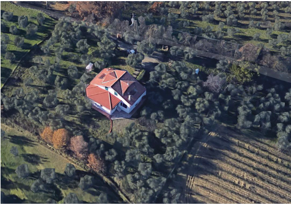
FOTO 7 - Veduta aerea del fabbricato.-