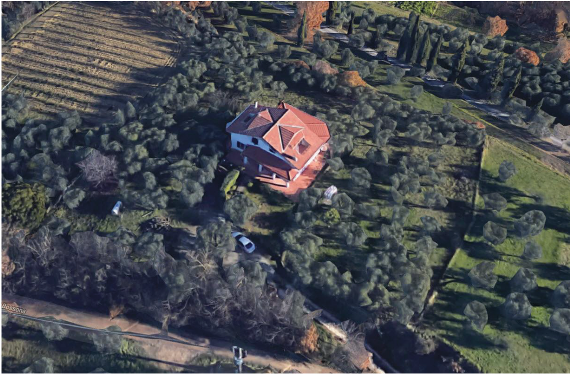
FOTO 5 - Veduta aerea del fabbricato.-