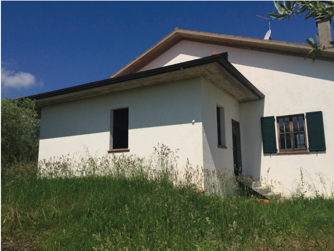
FOTO 3 - Veduta del fabbricato ripreso dal resede esclusivo.-