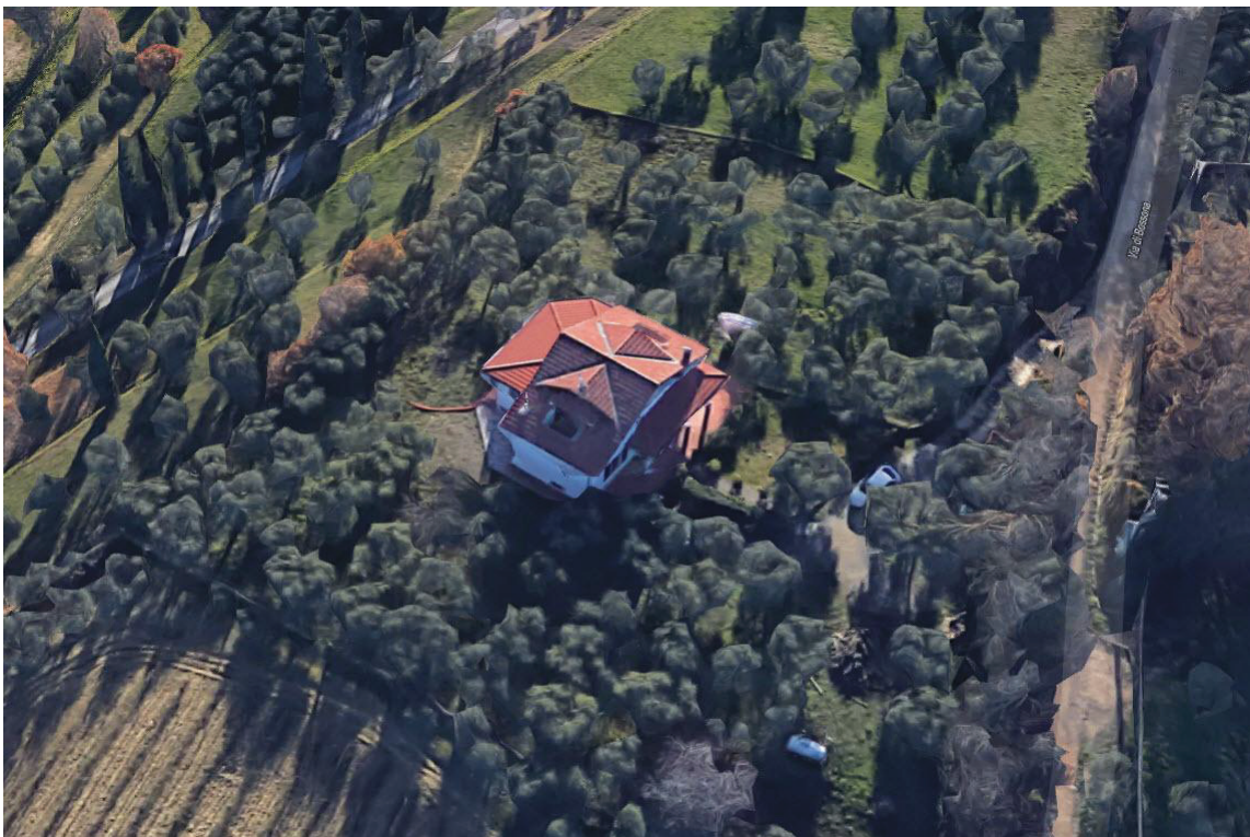
FOTO 6 - Veduta aerea del fabbricato.-