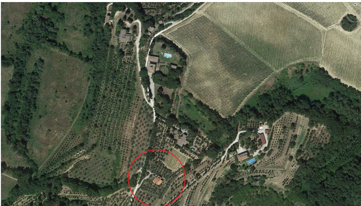
FOTO 1 - Veduta aerea del fabbricato.-