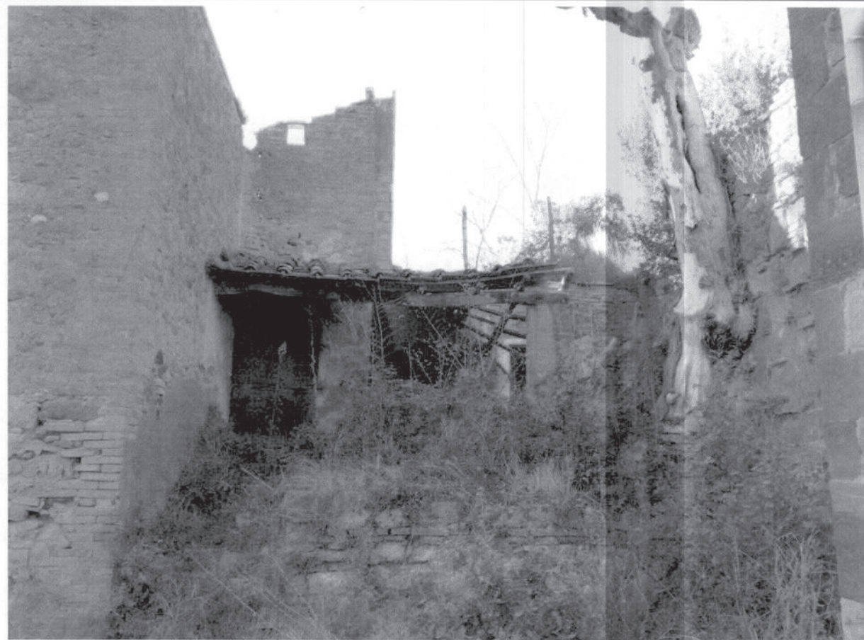
FOTO – AGGIUNTA TRA IL XIX E IL XX SEC (PERTINENZA N. 3 ISOLATA MA COLLEGATA)