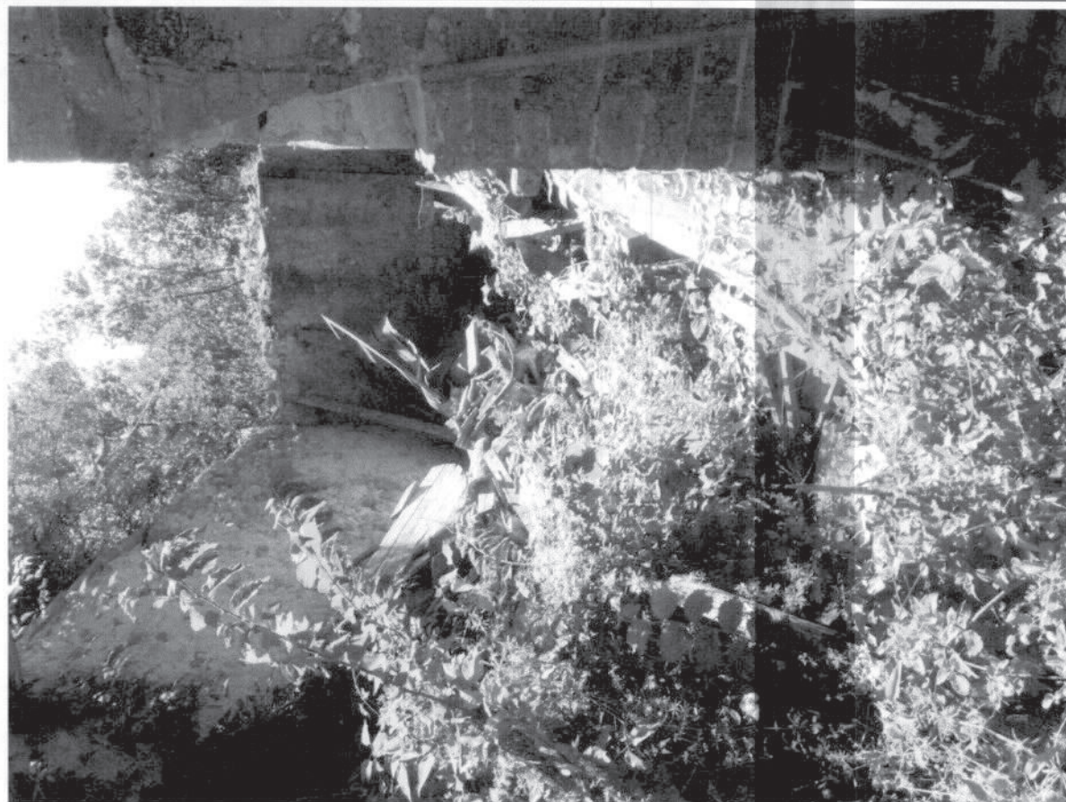
FOTO – EDIFICIO 1 PRINCIPALE E AGGIUNTA TRA IL XIX E IL XX SEC (PERTINENZA N.3)