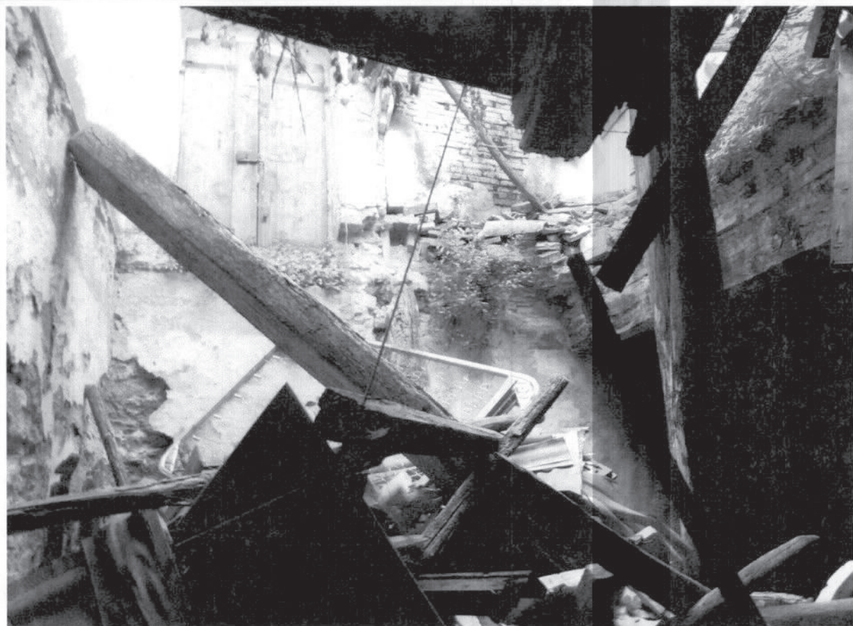
FOTO – AGGIUNTA TRA IL XIX E IL XX SEC (PERTINENZA N. 3 ISOLATA MA COLLEGATA) - INTERNO