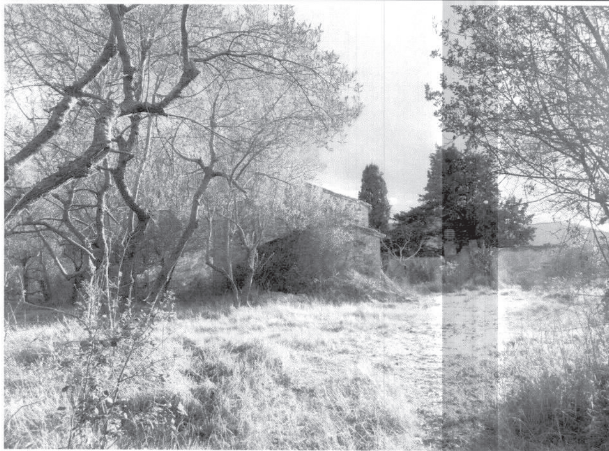
FOTO – EDIFICIO I PRINCIPALE E AGGIUNTA DEL XIX SEC (PERTINENZA N.2).