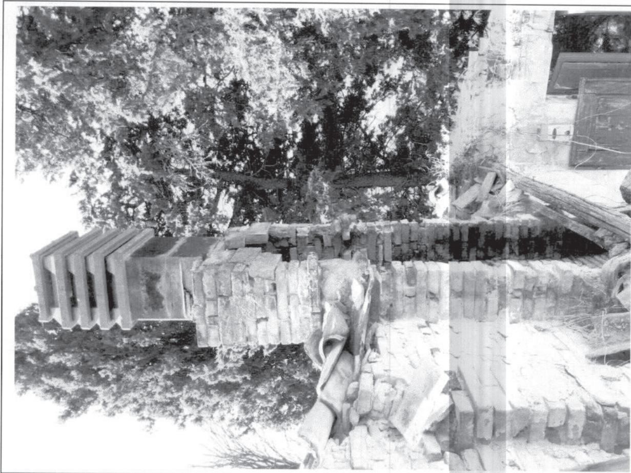
FOTO – COLLEGAMENTO CROLLATO TRA EDIFICIO PRINCIPALE E PERTINENZA N.3