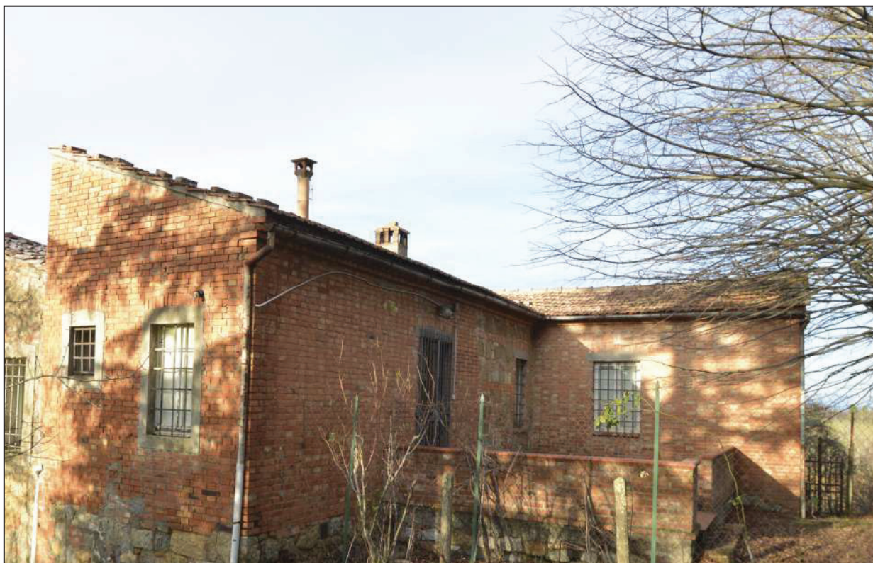
6 Vista del retro dell'ultimo ampliamento, realizzato senza considerare le caratteristiche dell'architettura rurale tradizionale. Porzione di abitazione per la quale si richiede un classamento abbassato a C4, come per le scale sottostanti.

via trassimeno n.1 53042, Chianciano Terme (SI) tel. 0578.31330 fax 0578.31578 email: lorenzoferi@studioferi.com mirabarr@studioferi.com p.iva 01486690520 www.studioferi.net