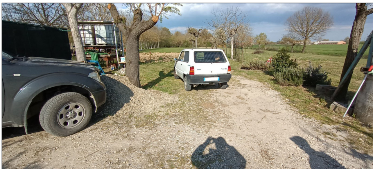
Foto n. 3 - vista dell'area di pertinenza.