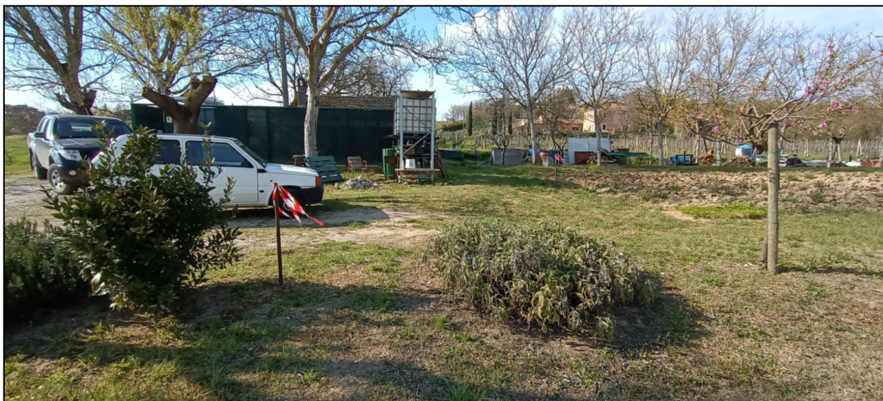
Foto n. 4 - vista dell'area di pertinenza con picchetti e nastro (perimetrazione sul lato est - stacco di separazione con l'area coltivata).