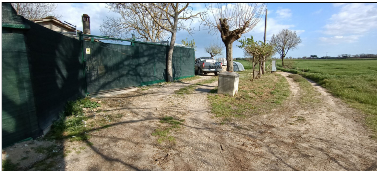
Foto n. 1 - vista dell'area di pertinenza dalla strada di via della Fornace (lato ovest).