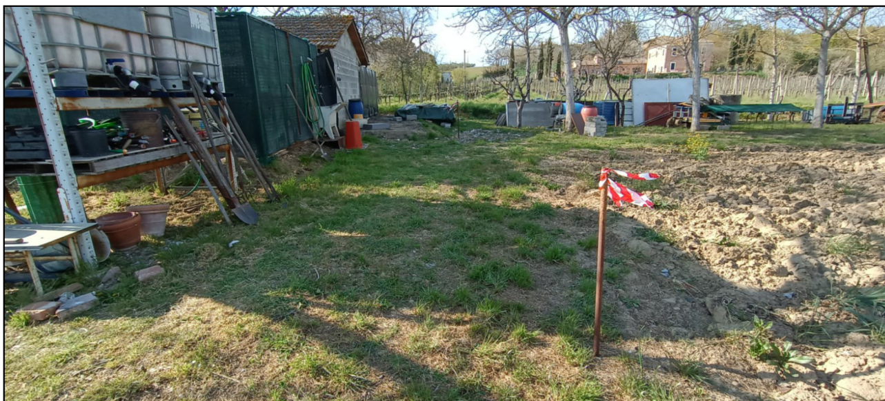
Foto n. 5 - vista dell'area di pertinenza con picchetti e nastro (perimetrazione sul lato est - stacco di separazione con l'area coltivata).