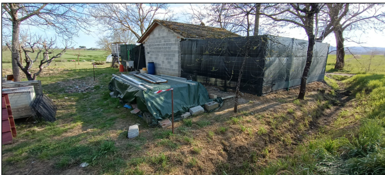
Foto n. 6 - vista dell'area di pertinenza con picchetti e nastro (perimetrazione sul lato est - stacco di separazione con l'area coltivata).