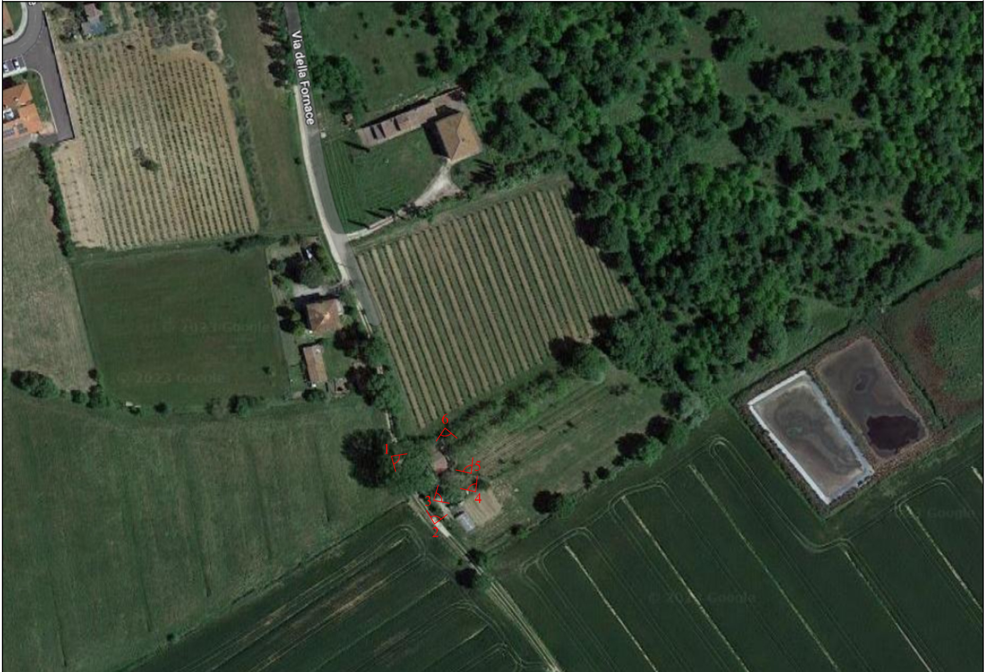
FOTO AEREA DELL'AREA CON INDICAZIONE DEI PUNTI DI RIPRESA FOTOGRAFICI