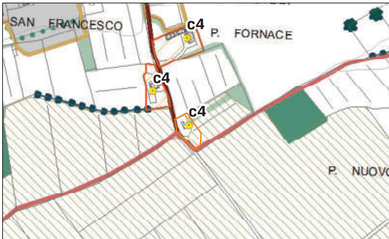
Estratto Tav. 01 del P.O. di Montepulciano (Disciplina del territorio rurale) - via della Fornace snc, fraz. Abbazia di Montepulciano - ingrandimento con individuazione dell'area di pertinenza dell'annesso proposta con l'istanza.