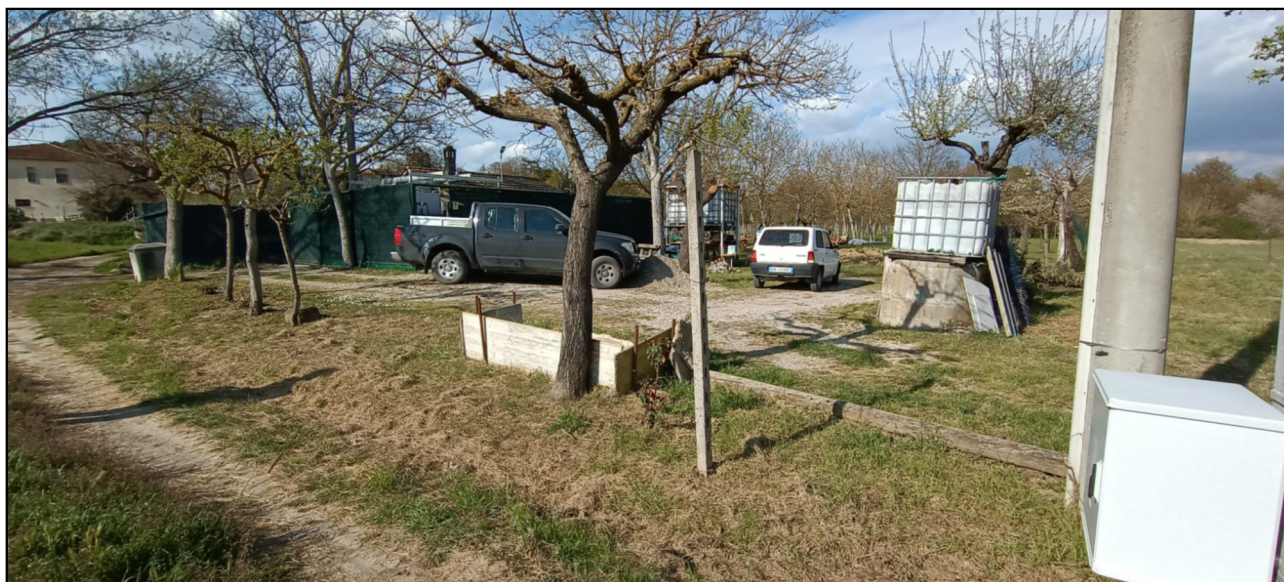
Foto n. 2 - vista dell'area di pertinenza dalla strada di via della Fornace (lato sud).