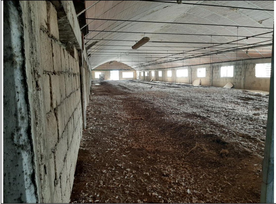
FOTO DELL'INTERNO DEL FABBRICATO