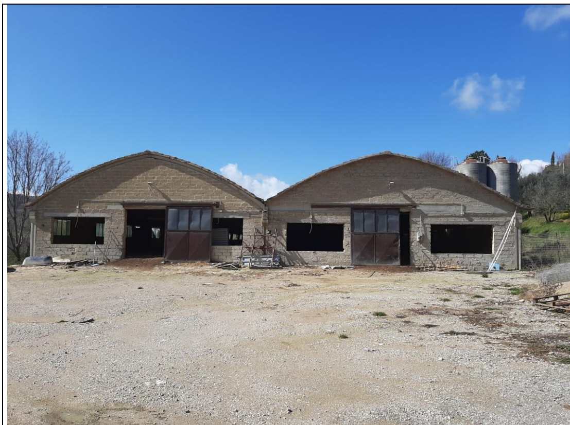
LATO FRONTALE DEL FABBRICATO (CAPANNONE EX ALLEVAMENTO)