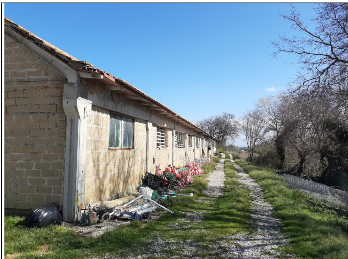
LATO NORD A VALLE DEL FABBRICATO